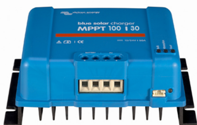
Controlador de carga solar MPPT 100/30